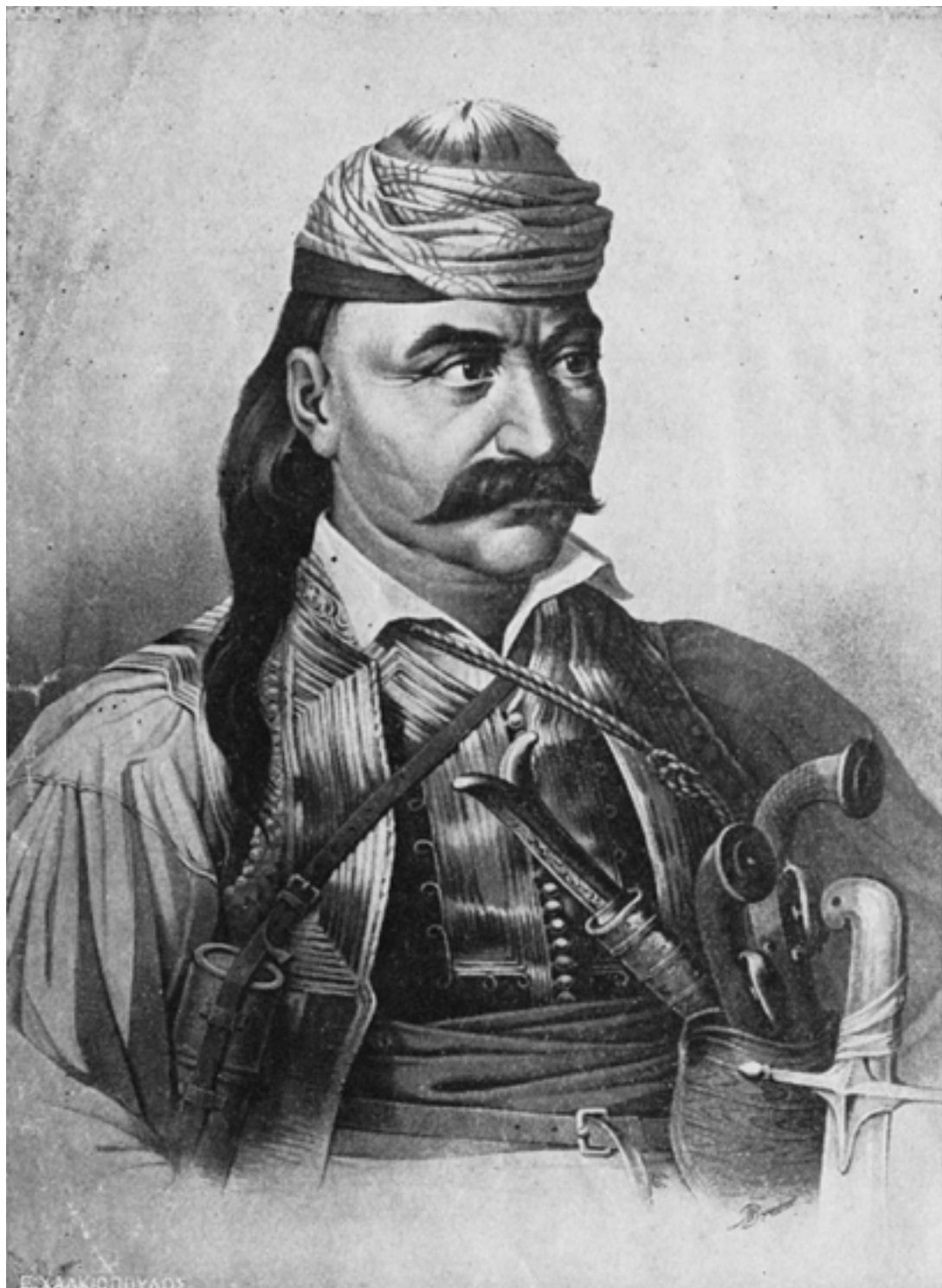
Ο Γέρος του Μοριά.