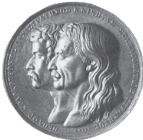
Ο Θεόδωρος Κολοκοτρώνης και ο Νικηταράς σε αναμνηστικό μετάλλιο.