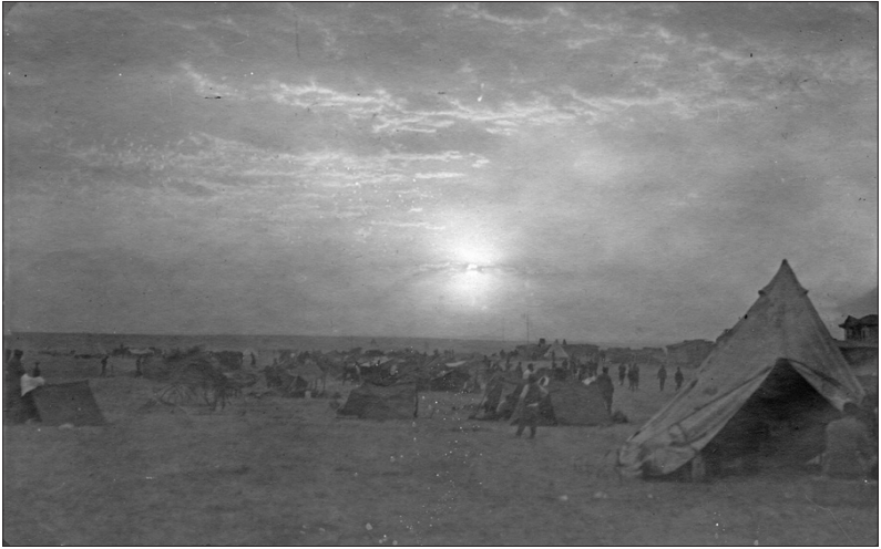
Προσωρινός καταυλισμός της Στρατιάς Μικράς Ασίας κατά την εκστρατεία προς την Άγκυρα, ανατολικά του Σαγγάριου ποταμού.