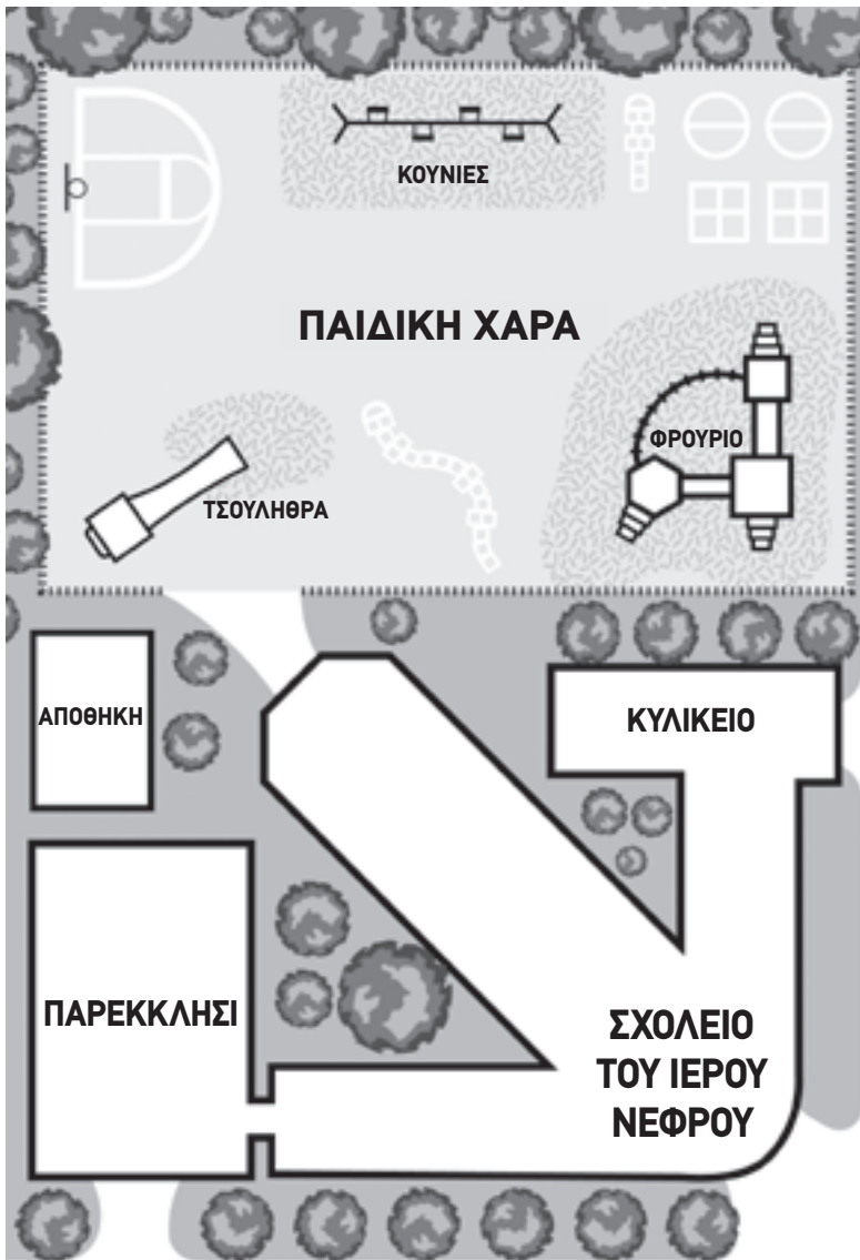
ΤΕΚΜΗΡΙΟ Α: ΧΑΡΤΗΣ ΤΟΥ ΙΔΙΩΤΙΚΟΥ ΣΧΟΛΕΙΟΥ ΤΟΥ ΙΕΡΟΥ ΝΕΦΡΟΥ